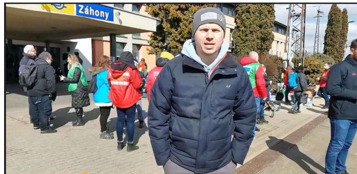
Dworzec kolejowy Záhony / Węgry

Polecam bezpośrednio, w miarę możliwości, zapoznanie się z tym reportażem z granic. Znajdziecie w nim również opinie napotkanych tam osób, co znacznie szerzej pozwoli zrozumieć sytuację. Przedstawiciele służb granicznych, wolontariusze i zwykli obywatele informują o zasadach przyjęcia i pobytu uchodźców w ich krajach oraz zakresie udzielanej pomocy.