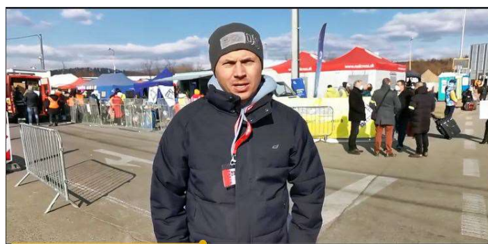
Przejście graniczne Vysne / Słowacja