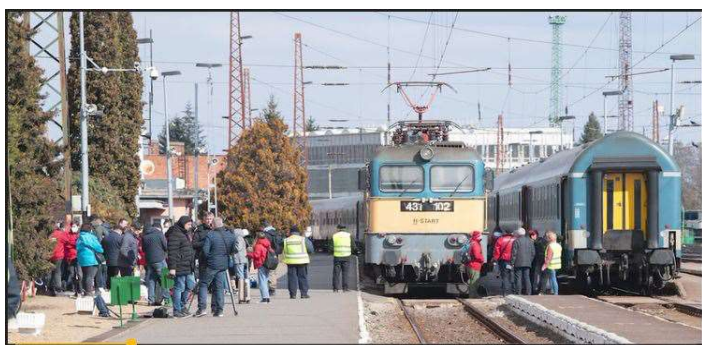
Dworzec kolejowy Záhony / Węgry