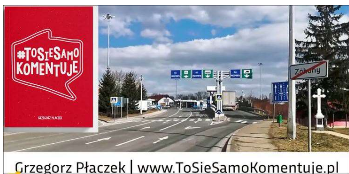
Przejście graniczne Záhony / Węgry