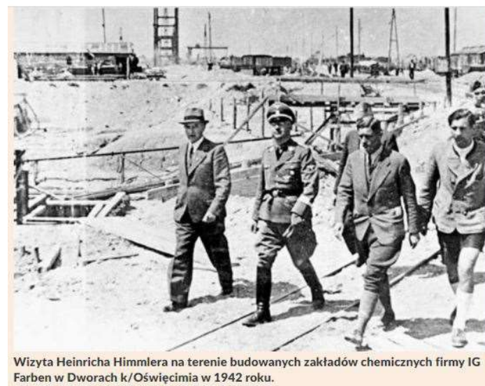
Wizyta Heinricha Himmlera na terenie budowanych zakładów chemicznych firmy IG Farben w Dworach k/Oświęcimia w 1942 roku.

Dyrektor I.G. Farben, Otto Ambros, tak posumował w swoim liście do kolegi ustalenia poczynione z nazistami: „Nasza nowa przyjaźń z SS jest bardzo owocna”.