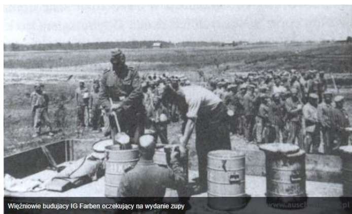
Więźniowie budujący IG Farben oczekujący na wydanie zupy

Na zdjęciu polscy pracownicy oczekujący na zupe.